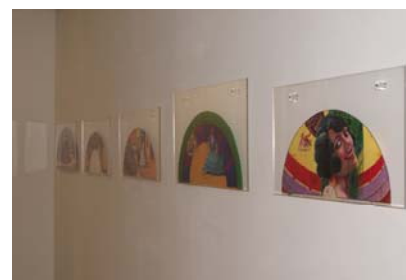
Vista de una de las salas de exposición

También se exhiben 12 abanicos completos de 1900 a 1930, de las Colecciones del Museo, para completar el panorama de la época. [CRZ]