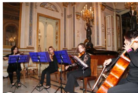
Concierto de abril con el cuarteto "A la corda"

Por último, el concierto del mes de junio (día 25) contó con el cuarteto de saxofones Púrpura Pansa. Esta joven agrupación musical, compuesta por cuatro saxofonistas acompañados por un piano, eligió un amplio repertorio con el que pretende explotar al máximo la potencialidad y las cualidades de este instrumento. [LPA]