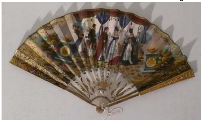
Abanico de estilo cristino, 1830

Sirvan estas líneas, para expresar nuestro más sincero agradecimiento a todos ellos por sus desinteresados y generosos gestos, y por hacer que este museo se enorgullezca de contar a fecha de hoy, con más de mil donantes desde que hace ya 58 años abriese sus puertas al público. [MJS]