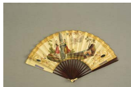
Abanico conmemorativo de la Constitución de 1812

bién ha sido cedido un busto de Fernando VII de la fábrica de Alcora, una peineta fernandina y un excepcional abanico conmemorativo de La Pepa que el Museo Nacional de Cerámica tiene depositado en el Museo de Historia de Valencia. [PGB]