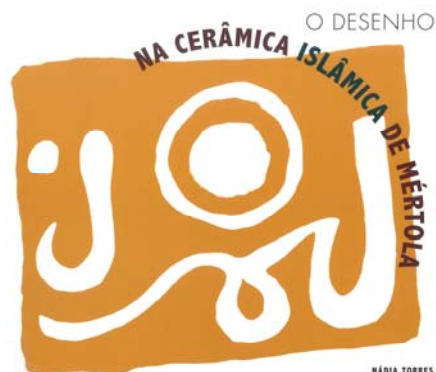
O desenho na cerâmica islâmica de Mértola (2011)