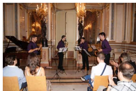
Concierto del mes de junio con Púrpura Pansa