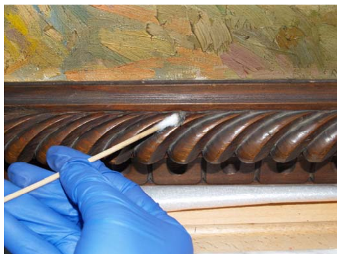
Proceso de limpieza de un marco. A la izquierda ya se ha eliminado suciedad acumulada

cos de contaminación fúngica encontrados, combinada con una limpieza de la suciedad superficial no adherida que se acumula tanto en marcos, como en los reversos de los lienzos y superficies pictóricas. Estas acumulaciones contienen partículas de contaminantes y esporas que, en combinación con una humedad relativa alta, se convierten en un foco de alteraciones químicas y biológicas. La limpieza es una de esas actividades fundamentales para la conservación cuyos efectos sólo se aprecian cuando deja de realizarse. [IFB]