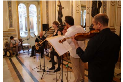
The Last Pint durante su actuación en el Salón de Baile del Museo

tivamente, el Día Europeo de la Música pretende celebrar algo tan universal como la música y tan sorprendentemente variado. Desde el Museo se cumplía con los objetivos que deben regir la celebración de este Día, haciendo un homenaje a la enorme riqueza cultural que supone la música mediante un concierto gratuito que ofreció la posibilidad de actuar a una formación joven pero de enorme calidad como The Last Pint . [LPA]