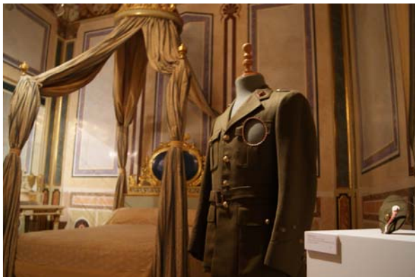
Una de las piezas de Con—decorados instalada en el Dormitorio del marqués en la planta noble del Museo

El Museo presentó del 3 al 27 de mayo varias exposiciones individuales y colectivas de joyería contemporánea ocupando todos los espacios de exposiciones temporales e incluso interviniendo en algunas salas del palacio. Las muestras se enmarcaban dentro del proyecto "Melting point. Joyería contemporánea Valencia" organizado por la Escuela de Arte y Superior de Diseño de Valencia (EASD) para celebrar los diez años de implantación de la disciplina de joyería en dicha escuela. Junto a otras instituciones de la