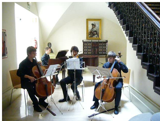
Una de las actuaciones en el Salón de los Pinazo

El proyecto fue diseñado por la Asociación de Amigos del Museo como un producto cultural para dos etapas. A medio plazo hasta el año 2004, en que se conmemoró el cincuenta aniversario del Museo en el palacio de Dos Aguas. Y a largo plazo hasta el año 2010, concurriendo en la idea de “Los jóvenes por una Cultura de Paz y No Violencia” dentro del perfil de la Unesco.