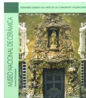
Ejemplar dedicado al Museo dentro de la colección de Grandes genios del arte de la Comunidad Valenciana

La Asociación de Amigos del Museo ha donado el catálogo de la exposición Els ballets rusos de Diaghilev : 1909-1929 (2012) [TRC]