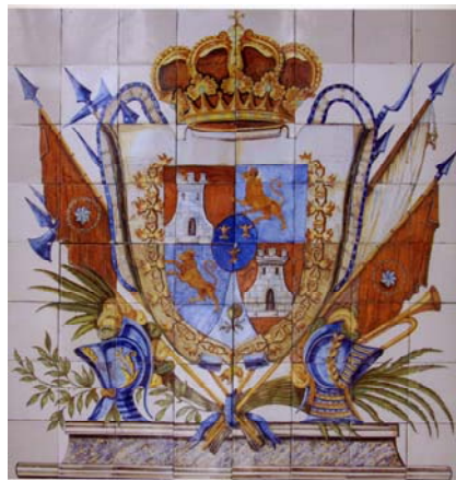
Panel de azulejo con el “escudo abreviado” de España