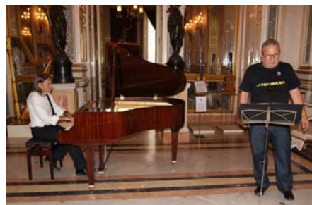
Apa ya es un habitual en los conciertos