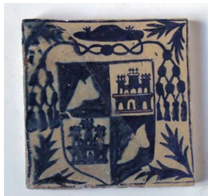
Azulejo con escudo del obispo Hernando Arenós de Boil, Manises, segunda mitad del siglo XV, CE1/08316. Expuesto en la sala de la cerámica arquitectónica medieval.