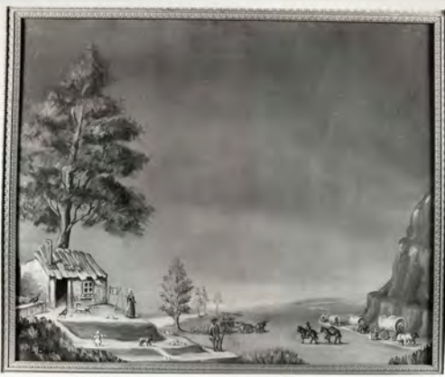
Lucrecia Bori, Pioneros del Oeste americano

Excepto la mencionada pitillera, los demás fondos no se encuentran expuestos en la actualidad.