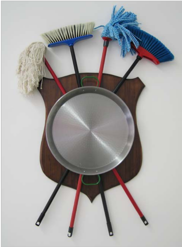
Delirios de Grandeza IV. 2005. © Mateo Maté. VEGAP. Madrid 2013