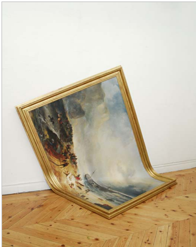
Shipwreck . 1996 © Mateo Maté. VEGAP. Madrid 2013