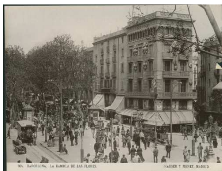
La rambla de las Flores en Barcelona, 1911-1928.

Por último, también está presente en la exposición la labor editorial de la Comisaría Regia, a través de las fototipias que Hauser y Menet hicieron para la España Artística, Monumental y Pintoresca .