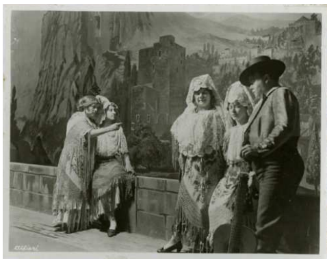
ALFIERI, Exposición "Sunny Spain" de Londres , 1914.

Las exposiciones y congresos fueron un medio excelente para dar a conocer nuestro país. Además de los actos celebrados en España, la Comisaría hizo un gran esfuerzo por divulgar nuestras excelencias en el extranjero, destacando la organización de una exposición en Londres en 1914 llamada "Sunny Spain", o diferentes incursiones en Estados Unidos.