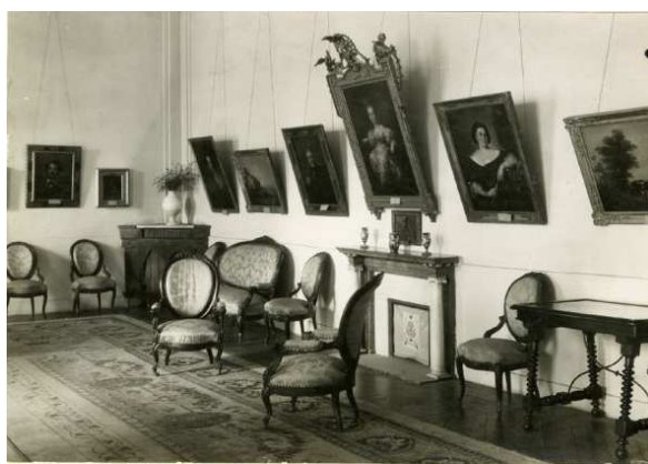
Salón de Isabel II en el Museo Romántico, 1924.

También el Museo Romántico, hoy Museo del Romanticismo y que este año cumple su 90 aniversario, fue fundado por Benigno de la Vega Inclán.