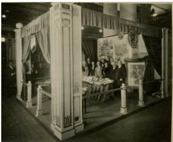
Expositor de la Comisaría Regia del Turismo en Estados Unidos, Años 20.