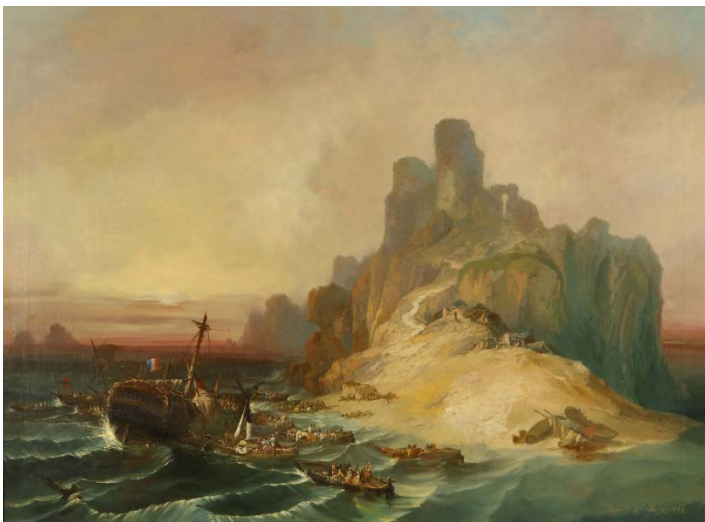
Eugenio Lucas Velázquez, Naufragio en la costa . 1855 Museo Nacional del Romanticismo

También destaca la compra mediante distintas fórmulas, como la oferta de venta o la compra en pública subasta por parte del Estado. Éstas tratan de completar y enriquecer la