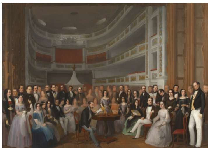
Antonio María Esquivel, Ventura de la Vega leyendo en el Teatro del Príncipe . 1846 Museo del Prado. En depósito en el Museo Nacional del Romanticismo