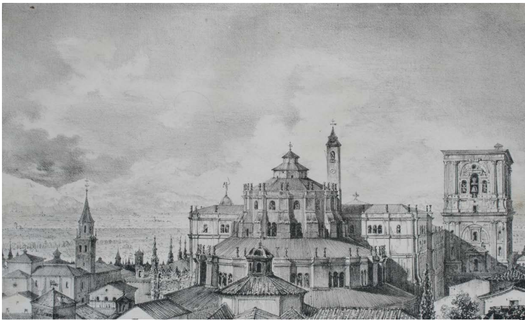
Francisco Aranda Delgado, Catedral de Granada Revista El Artista , Tomo I, 1835. Biblioteca del Museo Nacional del Romanticismo

Aunque la carrera de Francisco Aranda se centró fundamentalmente en la escenografía, en la que destacó de forma notable, tal y como alaban las críticas contemporáneas, por su realismo, sentido espacial y magisterio en el dibujo, hay otra faceta de su producción que también despunta, y es la de ilustrador para varias revistas y publicaciones. Entre estas hay que resaltar sobre todas las realizadas para El Artista , publicación fundada por Federico de Madrazo, autor del retrato de Aranda que conserva el Museo del Romanticismo.