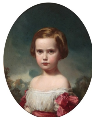
Federico de Madrazo, Retrato de niña . ca. 1870 Museo Nacional del Romanticismo

Si bien sus primeros intereses dentro del arte lo llevaron a decantarse por la pintura de composición, su realidad posterior, una vez establecido definitivamente en Madrid en 1842, lo llevaron a dedicarse por entero al retrato , género cuyos cánones reformuló hacia el Romanticismo . La influencia de su pintura quedó asentada al ser nombrado primer pintor de