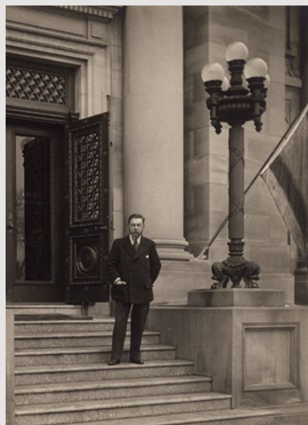
J. Sorolla ante la Hispanic Society of America , Sebastián Cruset, 1909

Ese verano, en un clima de euforia por el éxito obtenido, lo pasa en Valencia con su familia, y en sus playas