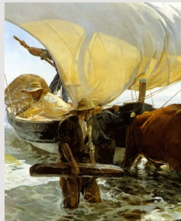
La vuelta de la pesca (detalle), J. Sorolla, 1895. Museo D'Orse