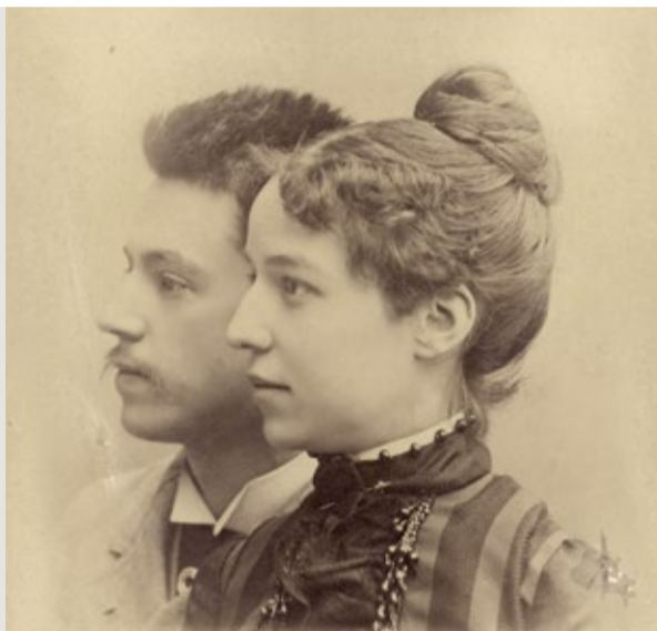
El matrimonio Sorolla, Antonio García Peris, 1888