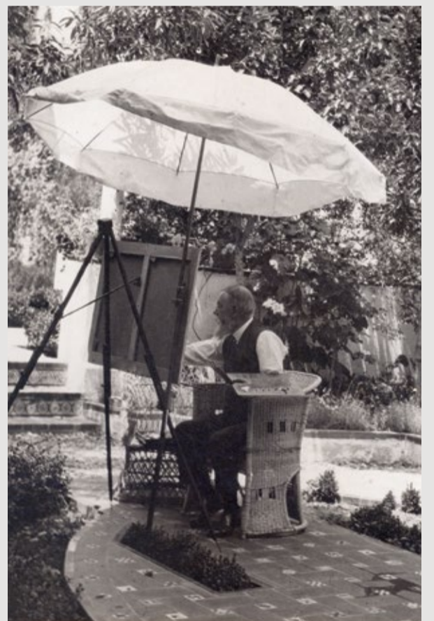
Joaquín Sorolla pintando , Arthur Byne, 1920

Sorolla presenta exposiciones en The Art Institut de Chicago y en The City Art Museum de San Luis (Missouri). Ese verano descansa con su familia en San Sebastián y allí pinta La siesta . Firma el contrato con Huntington para pintar los paneles de la Visión de España para la Biblioteca de la Hispanic Society. A finales de año la familia se traslada a su nueva casa.