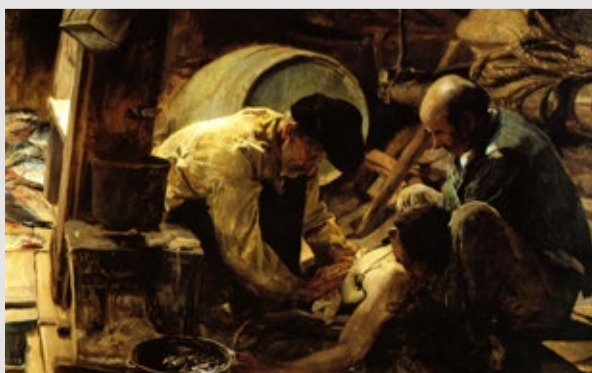
¡Aun dicen que el pescado es caro!, J. Sorolla, 1894. Museo del Prado

Sorolla concurre regularmente a los certámenes importantes enviando grandes cuadros en la línea del realismo social con la ambición de darse a conocer. Gana una medalla de primera clase en la Exposición General de Bellas Artes de Madrid con la obra ¡Y aún dicen que el pescado es caro! , que el Estado español adquiere para el Museo Moderno (hoy en el Museo del Prado); y ese mismo año envía al Salon des Artistes Français los cuadros Trata