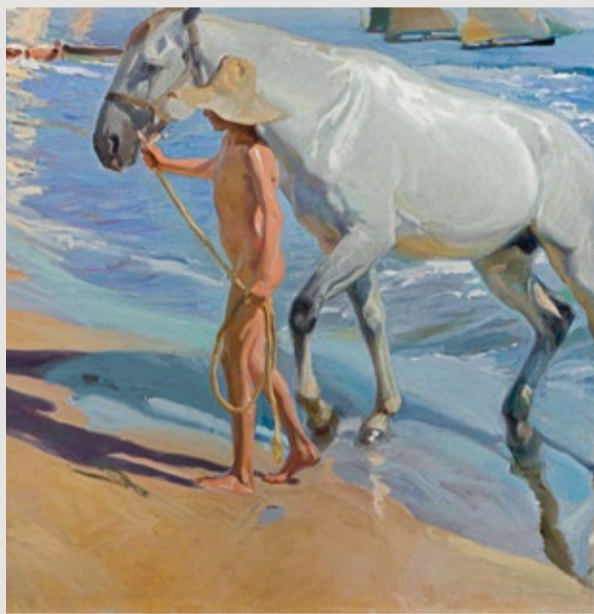
El baño del caballo , J. Sorolla, 1909

realiza Sorolla algunas de sus obras más famosas: Paseo a orillas del mar , El baño del caballo o El balandrito .