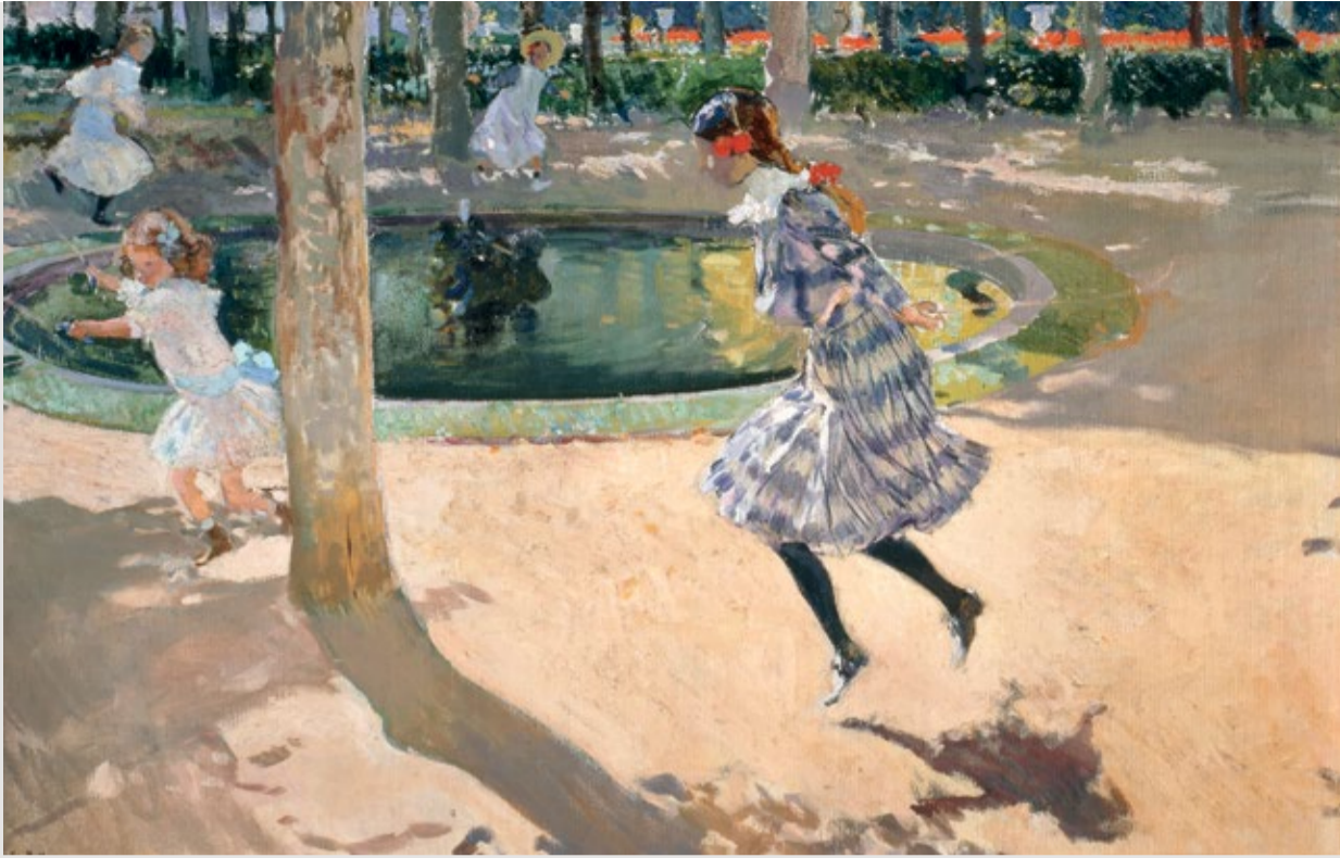
Saltando a la comba, La Granja , J. Sorolla, 1907