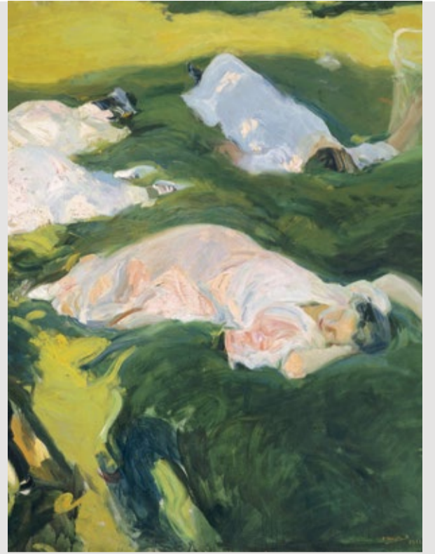
La siesta , J. Sorolla, 1911