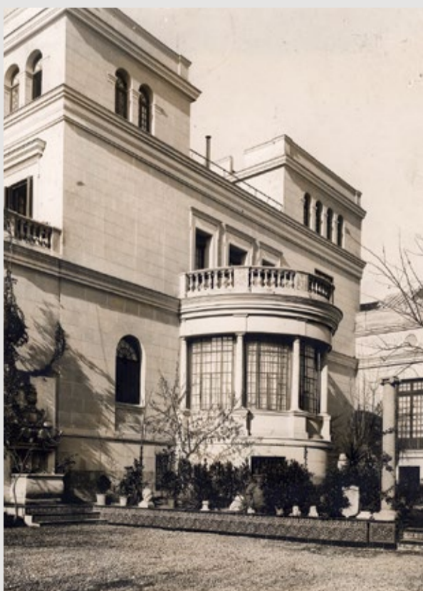
Vista general de la Casa Sorolla , Campúa, 1914

Sorolla comienza a construir su casa en el entonces Paseo del Obelisco, hoy Pº del General Martínez Campos 37.