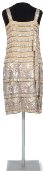
Jean Alexandre Patou. Vestido, ca. 1925. París