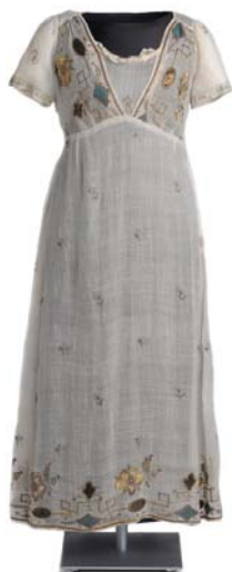
Diseñador desconocido. Vestido, ca. 1908-1910