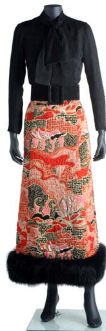
Marc Bohan para Christian Dior. Falda, blusa y cinturón, 1970 – 1971. París

Ministerio de Cultura Plaza del Rey, 1. 28004 Madrid 91 701 62 08 promocionArte@mcu.es