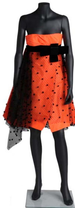
Christian Lacroix. Vestido, 1999. París

Ministerio de Cultura Plaza del Rey, 1. 28004 Madrid 91 701 62 08 promocionArte@mcu.es