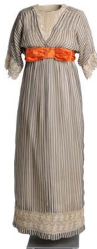
Paul Poiret (atribuido). Vestido, ca. 1911. París