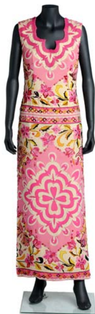
Emilio Pucci. Vestido, 1966. Florencia