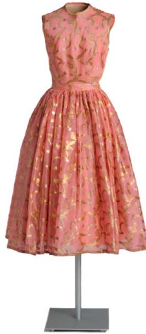
Traina-Norell. Vestido con cinturón, ca. 1950. Nueva York

Con la nueva sociedad que se conforma desde la posguerra, la Moda sufre un cambio radical que implica una mayor heterogenidad formal. Desde los años sesenta el abanico de clientes de Moda se amplía progresivamente y, con ello, los nombres de diseñadores reconocidos se suceden rápidamente. Se ha querido reflejar esa variedad en la muestra, dando cabida a un amplio listado de autores: Yves Saint-Laurent, Mary Quant, Biba, Valentino, Pucci, Ungaro, Courreges o Hanae Mori en los sesenta; Azzaro, Cardin, Léonard, Óscar de la Renta, Walter Albini o Roberta di Camerino en los setenta; Alaïa, Price, Gaultier, Capucci, Montana, Ferré, Gigli, Moschino y los japoneses Kansai Yamamoto y Comme des Garçons en los ochenta; y, por último, Mugler, Miyake, Gucci, Galliano, Tayama y Demeulemeester en la década final del siglo. Junto con ellos también se ha representado la continuidad de casas como Chanel, Yves Saint-Laurent o Dior, que ejemplifican la pervivencia de las firmas más allá de sus creadores originarios.