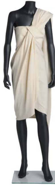
Gianfranco Ferré. Vestido, ca. 1980 – 1990. Italia