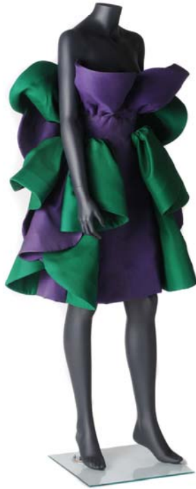
Roberto Capucci. Vestido, ca. 1980. Roma