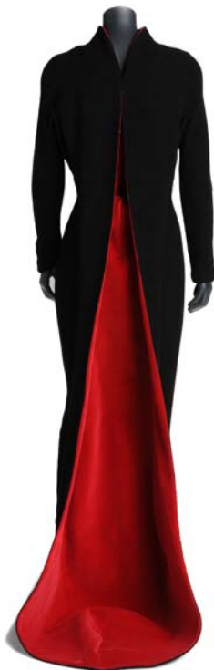
Thierry Mugler. Vestido, 1997 – 1998. París