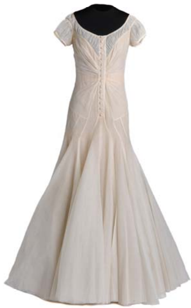
Coco Chanel. Vestido, ca. 1939