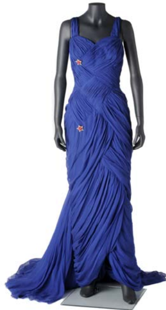
Jean Dessés. Vestido, 1955. París