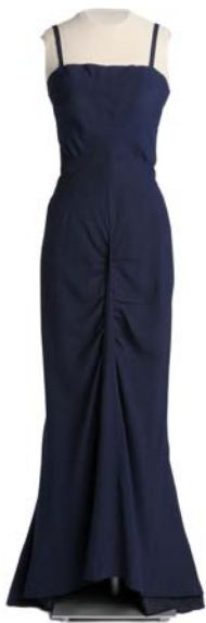
Elsa Schiaparelli. Vestido, ca. 1935. París