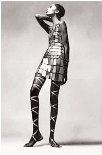
Vestido realizado con placas de metal. Primavera-verano 1968. París.

vos materiales artificiales (fibras artificiales) de uso fácil y económico. Y, a su vez, los tejidos sintéticos dieron lugar a innovadores y futuristas diseños de texturas artificiales y a toda una moda de la Era Espacial creada por Pierre Cardin en 1964.