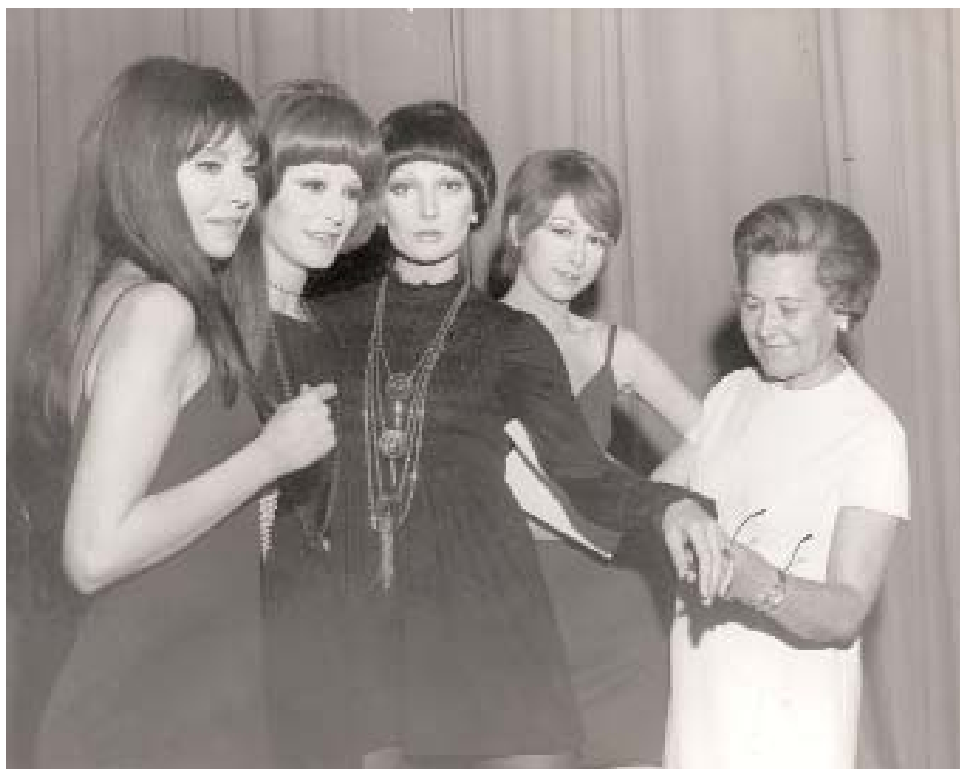
Carmen Mir preparando a sus modelos para uno de sus desfiles en 1970.

Carmen Mir (1903-1986) funda su Casa de Alta Costura en 1940, aunque su primera colección la presentó en 1925. En los años 70 comienza su línea de prêt-à-porter . La Casa ha permanecido abierta durante más de 30 años y la continuadora de la firma, la Sra. Elisa Lacambra, ha seguido con costura a medida y prêt-à-porter hasta julio de 2006.