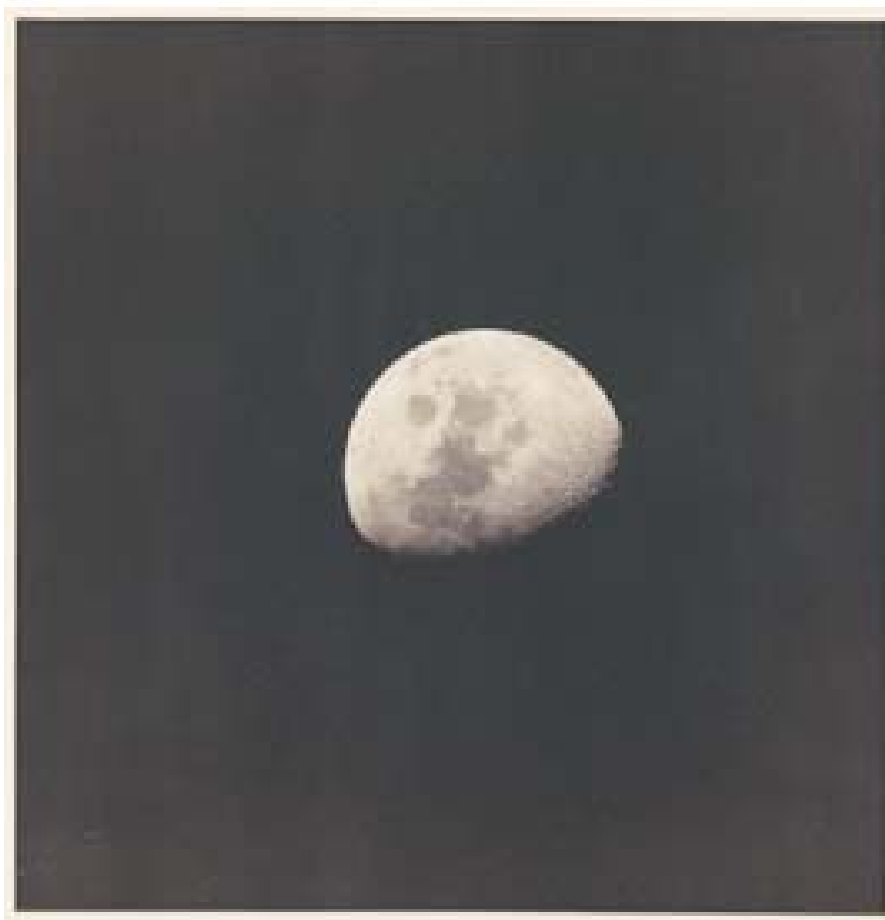
Imagen de la exposición "The Temptation of Space". Espace Louis Vuitton.

No cabe duda de que todos estos proyectos y trabajos nos vuelven a trasladar a la inmensidad del espacio. Por este motivo, he querido comenzar este estudio con la cita de Thoreau, "Cada generación se ríe de las modas pasadas, pero sigue religiosamente la nueva." Contradictorio, ¿verdad?