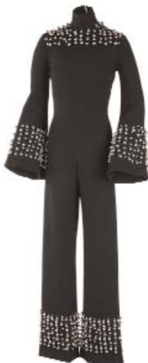
Traje pantalón Carmen Mir.

El traje pantalón de Carmen Mir forma parte de una colección de Alta Costura catalana expuesta temporalmente en el Museo del Traje de Madrid. Una interesante selección de modistos, desde los años 30 a los 80, como Manuel Pertegaz, Elio Berhanyer, Asunción Bastida o Pedro Rodríguez, entre otros.