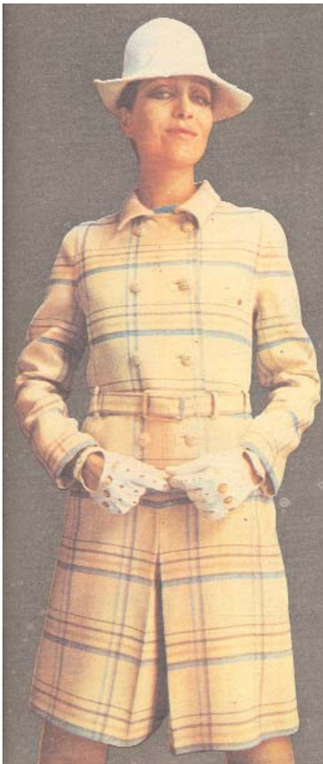
Traje sastre de Carmen Mir. Invierno 1968. Imagen sacada de la revista Ama (200), 1968. Reportaje de Josefina Figueras.

En los 60 y los 70 Carmen Mir presentó unas colecciones para una mujer moderna, independiente, segura de sí misma y fiel a sus tiempos.