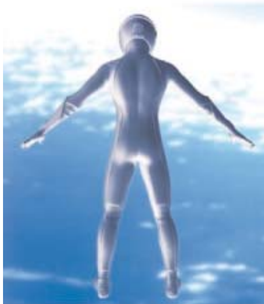
Imagen de la exposición “The Temptation of Space”. Espace Louis Vuitton.

La última muestra de este interés por lo espacial ha sido la exposición que se puede visitar en el Espace Louis Vuitton (Campos Elíseos de París), “The Temptation of Space”, en la que la presencia del hombre en el espacio se convierte en el argumento de la misma.