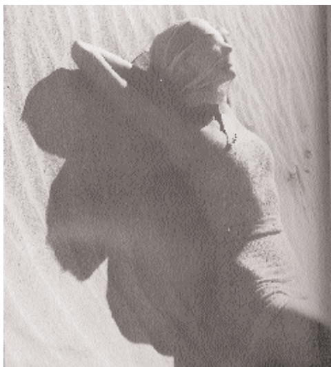
Traje de baño de Claire McCardell, 1948. Esta imagen apareció en el Harper's Bazar de mayo 1948.

Las mujeres en los años 20 y 30 ya utilizaban pantalón, pero su uso era exclusivo para la playa y la casa. Los "conjuntos de playa" o "pijamas de playa" eran piezas enteras de vestido pantalón largo, que las mujeres utilizaban como prenda informal y deportiva durante estas décadas. Por este motivo, podemos considerar a estos conjuntos como el antecedente más directo de los trajes pantalón, que a su vez empezarán a utilizarse en los 60 y 70. Al mismo tiempo, el traje de baño evolucionará hacia estructuras más sencillas, y la diseñadora americana Claire McCardell fue quien mejor supo transformar el traje de baño en una ropa deportiva más fresca y moderna.