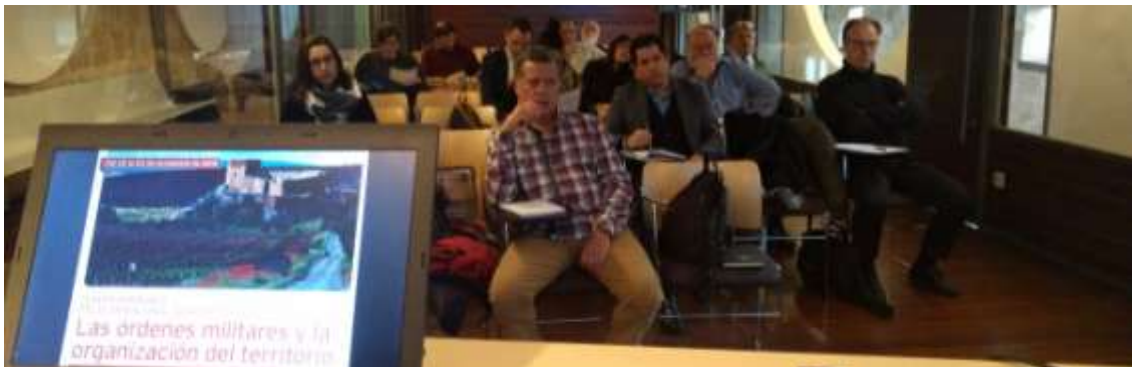
Un aspecto de la sala durante la inauguración del seminario