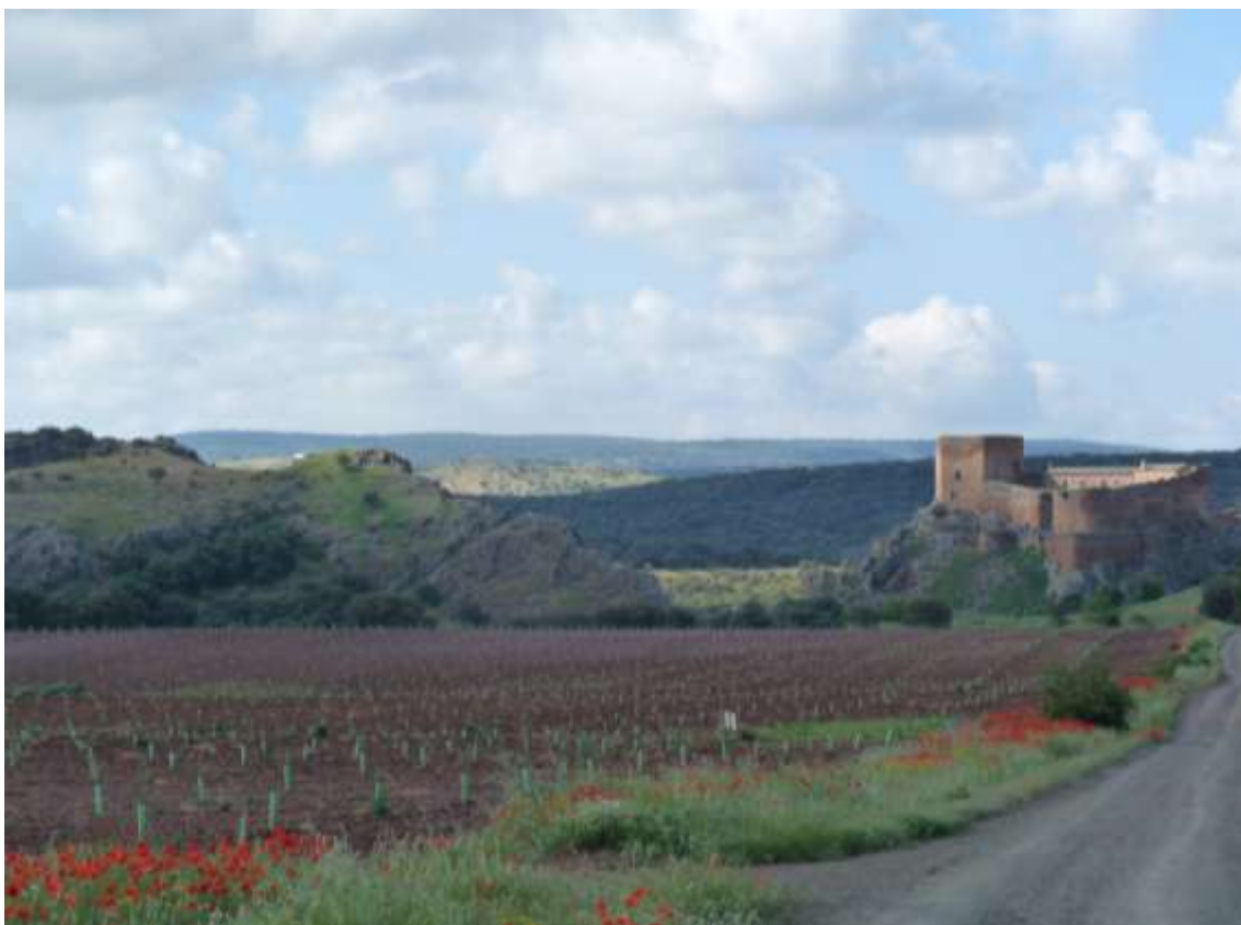
Castillo de Montizón (Ciudad Real).

ESCUELA DE PATRIMONIO HISTÓRICO DE NÁJERA 20-22 de noviembre de 2019