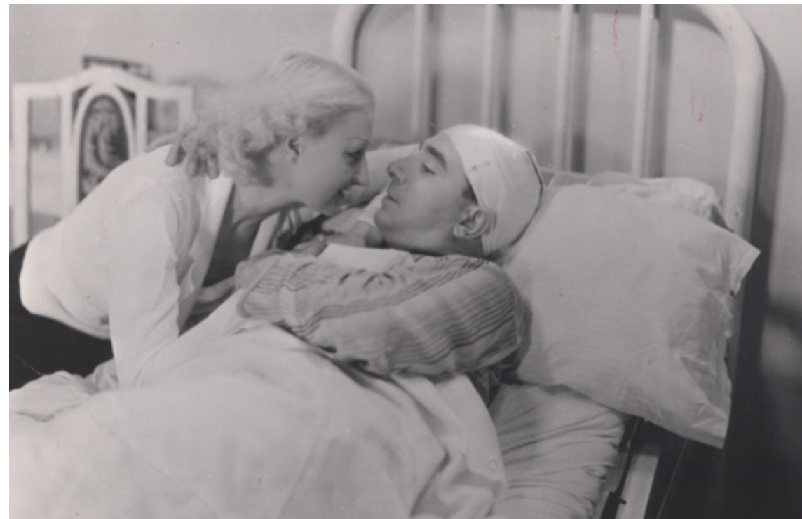
Carne de fieras

nizados) es Conchita Piquer, actriz de renombre que aparece en este ciclo en La bodega . El cine tuvo tanta atracción que, a partir de entonces, se comenzó a llamar "peliculeras" a las mujeres aficionadas al cine y "peliculeritas" a las que aspiraban a ser artistas trabajadoras en este medio.