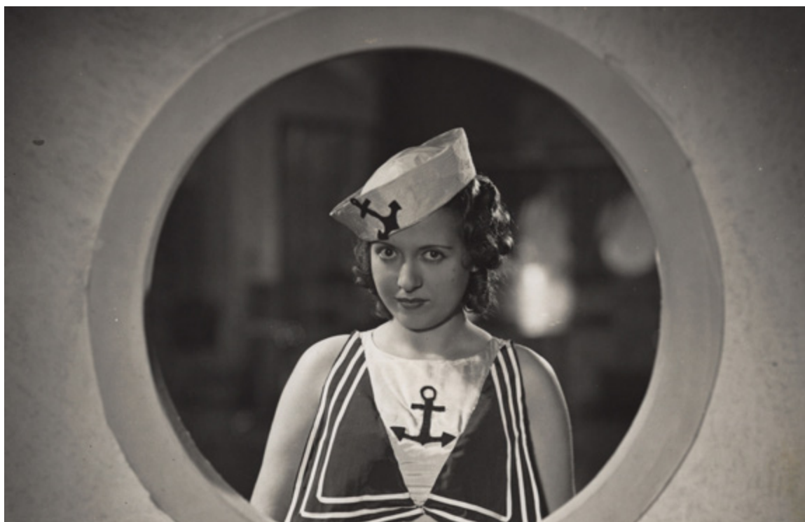
Abajo los hombres

En 1896 se proyectó por primera vez una película en España y, desde ese momento hasta finales de 1920, el cinematógrafo, como se decía en la época, fue mudo. Los filmes sonoros coparon la cartelera a partir de 1930. De hecho, la protagonista de la primera película sonora (es decir, audio y filmación sincro-