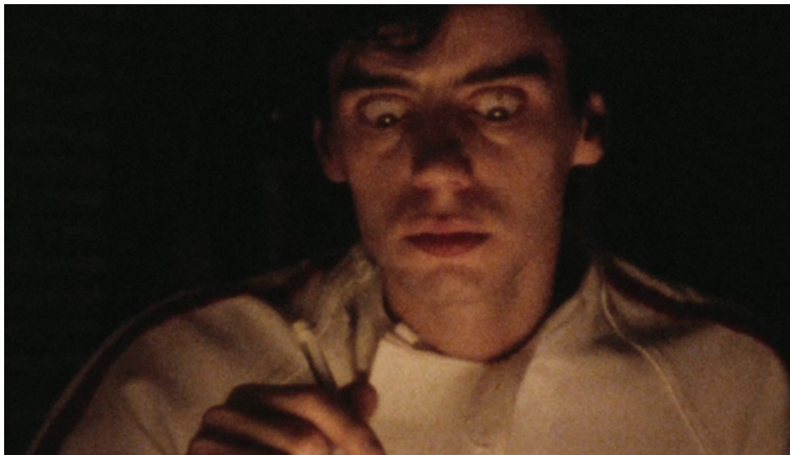
Alrededor de Arrebato

En definitiva, lo que presentamos es un corpus fílmico inédito de gran variedad que, esperamos, promueva la reflexión y el goce sobre una vida y obra tan compleja como única ●