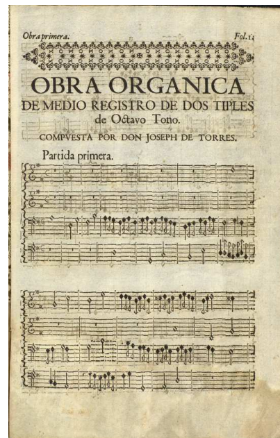
AHN, CONSEJOS, 26565, Exp.12