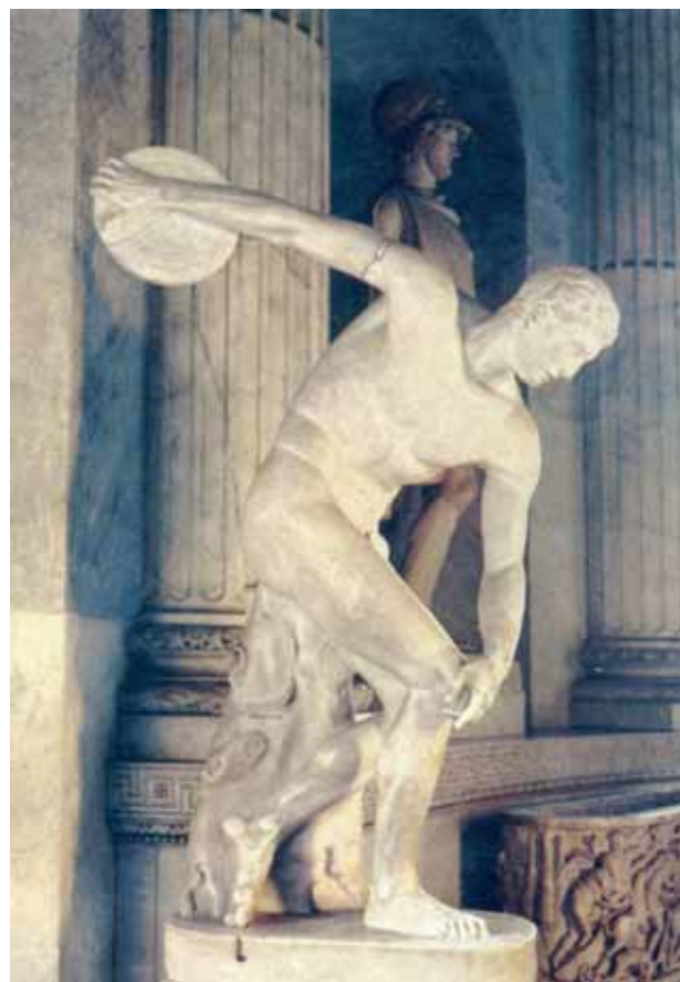
14. Mirón, Discóbolo , c. 450 a. C. Museos Vaticanos.

factores potencien el significado y valores plásticos de la obra. Aún cuando el fondo fuera de un tono similar al de las propias esculturas, éstas destacarían por su volumen, cuestión que no ocurriría si exponemos otro tipo de pieza pues ésta podría empastarse en exceso con su entorno, y se neutralizarían muchos de sus valores plásticos