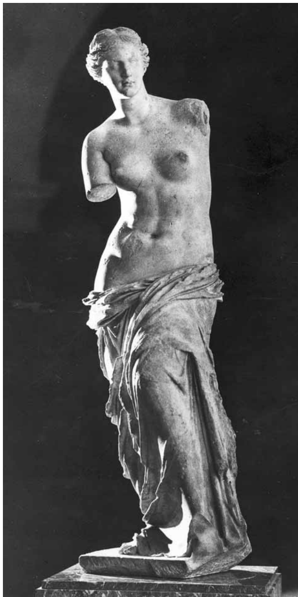
5. Venus de Milo . Siglo II a. C..

-pero que también distancia-, a La Pietà de Miguel Ángel para evitar que un desaprensivo pueda -de nuevo- agredir la fantástica escultura (figura 4).