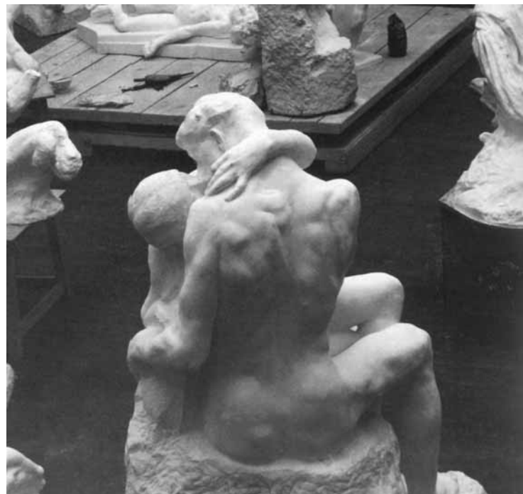
2. Taller de Auguste Rodin, 1904 (Foto: AA. VV., 1999).

La obra escultórica se encuentra especialmente ligada a la arquitectura. Probablemente es el arte con el que comparte más elementos y variables comunes en el proceso de gestación, y en muchos casos en la propia materialización (figura 1). Por otro lado, muchas de las obras escultóricas que se exhiben en los museos estaban pensadas en su génesis para que tuvieran una cercana y estrecha relación con espacios arquitectónicos.