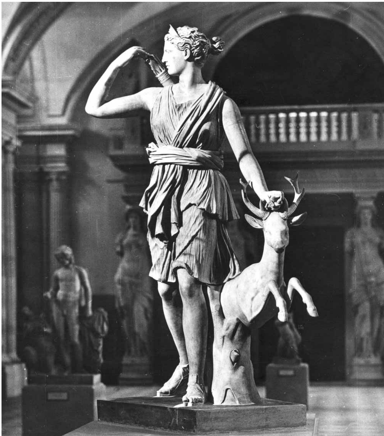
8. Artemisa Cazadora o Diana de Versailles, siglo I d .C. Museo del Louvre.

no será adecuada si los proyectores se disponen cruzados y las sombras se multiplican, por lo que es conveniente utilizar una iluminación general que sea potenciada con luz de acento y filtro específico de escultura: normalmente proyectores de lámpara haló-