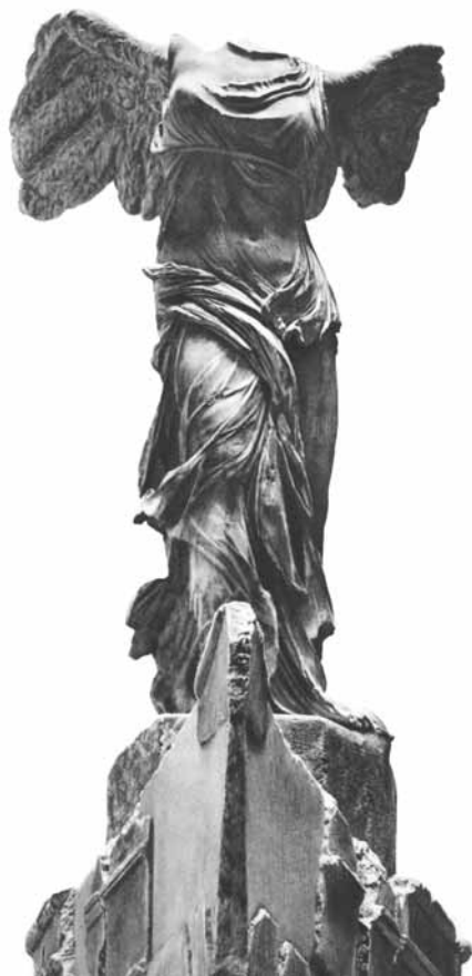
11. Victoria de Samotracia , siglos III-II a. C. Museo del Louvre.