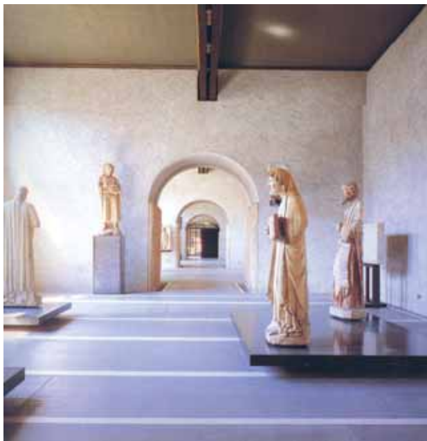
15. Galería de escultura de los siglos XII-XV. Museo Castelvecchio de Verona, 1956-1964.