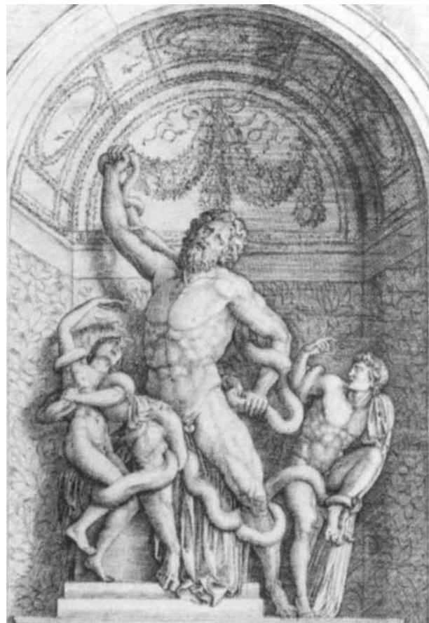
10. Francisco de Holanda, Dibujo de la hornacina del Laocoonte en el Jardín del Belvedere , siglo XVI. Monasterio de El Escorial, Madrid.

con la facilidad que nos brinda el hecho de que la radiación de infrarrojos (IR) no es excesivamente perjudicial para los materiales pétreos. La reproducción del color sin embargo pasa a un segundo plano. Hay que considerarla desde una óptica muy singular dado que la ausencia -en general- de policromía potencia los efectos de luces y sombras, y por consiguiente, la sensación de volumen.