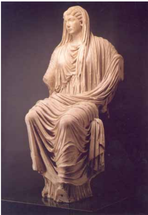
6. Escultura sedente de Livia , procedente de Paestum, siglo I d. C.