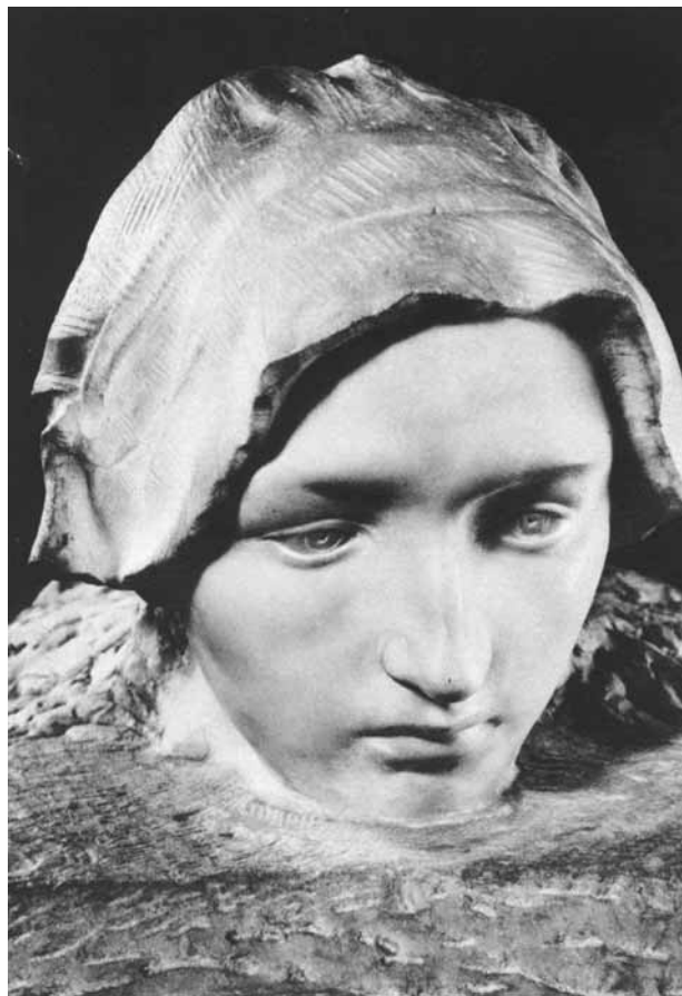
7. Auguste Rodin, El Pensamiento , 1886.

ni vitrinas como las piezas de pequeño formato. La obra escultórica se presenta tal cual, desnuda, sin ningún elemento añadido que lo enmarque.