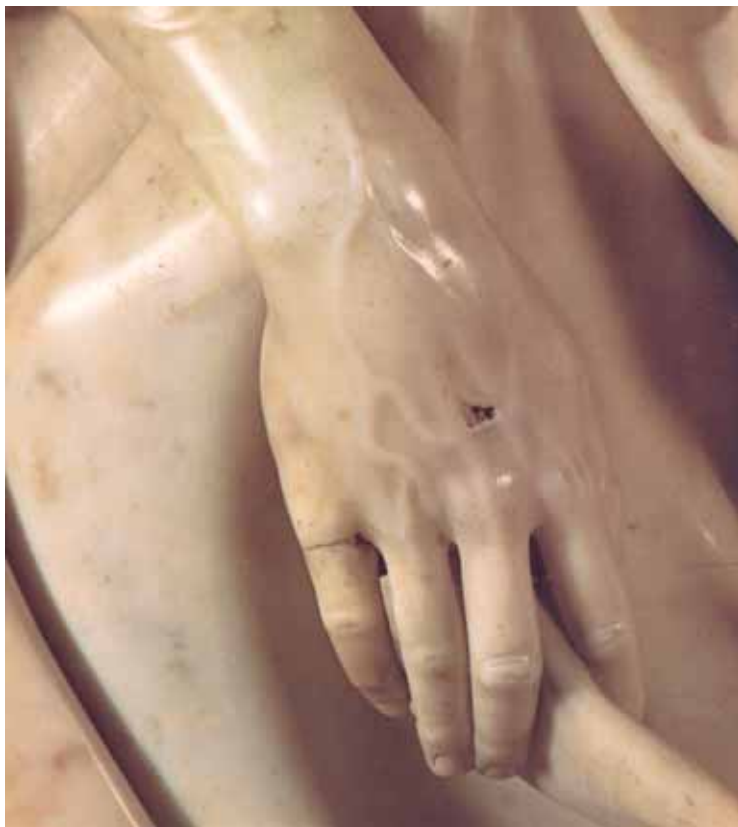
4. Miguel Ángel. Detalle de La Pietà .