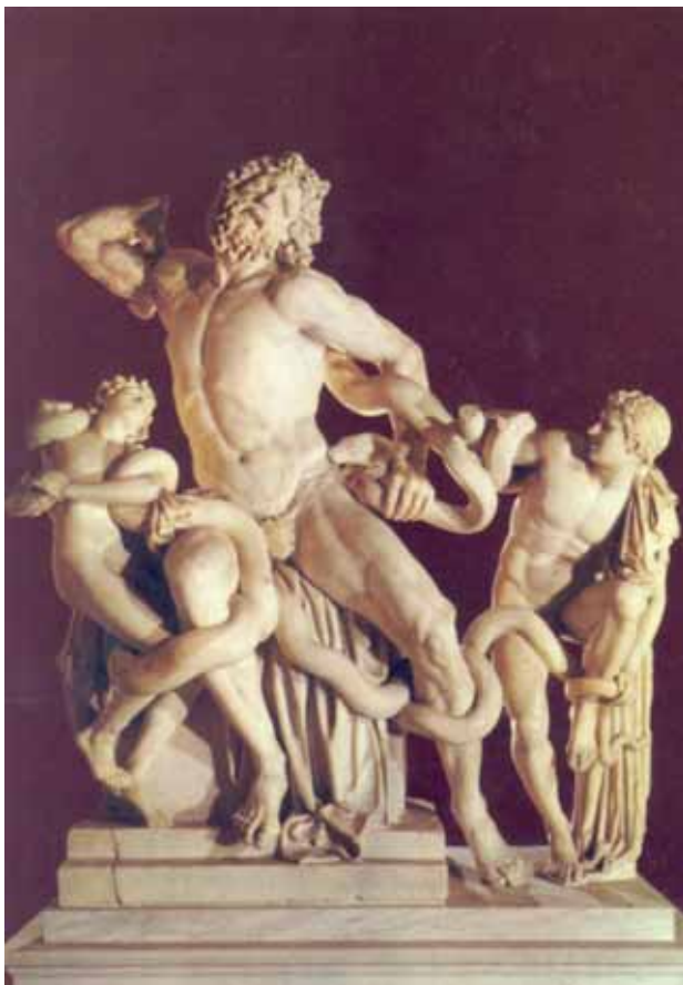
9. Grupo del Laocoonte , siglo I d. C. Museos Vaticanos.