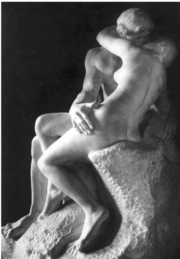
16. Auguste Rodin, El Beso , 1886. Musée Rodin.