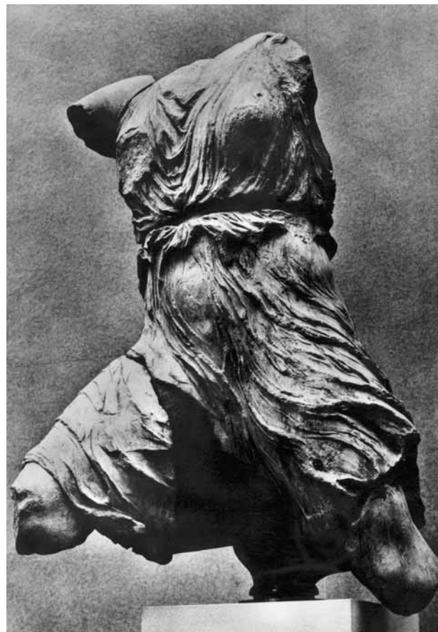
17. Iris , escultura procedente del Partenón, c. 435 a. C. British Museum.

secuencia, algunas obras escultóricas se han sacado de su contexto: no se presentan a la altura donde se preveía que fueran instaladas, y por ello posiblemente el autor había modificado las proporciones. Si se había previsto que se instalaran en un lugar alto con un escorzo forzado, probablemente se esculpían con partes desproporcionadas para que en su lugar de destino su visión fuera la correcta (figura 17). En este caso, instalar las piezas fuera de contexto puede ayudar a potenciar su valor didáctico. En contraste con la exposición de los óleos y los dibujos en donde la altura recomendada de colocación es la de situar el eje de la obra a 150 cm del suelo; esto es, al nivel de los ojos del visitante medio. En la presentación de la escultura esta altura es muy variable y depende de las sensaciones estéticas que la pieza proporciona.