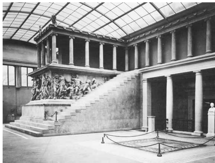
3. Pergamonmuseum.

El principal factor condicionante de la instalación museográfica de una gliptoteca -y por tanto la primera decisión a considerar-, es la definición del modelo expositivo en cuanto al modo de presentación de las obras, dado que éstas pueden exhibirse con una proximidad similar a como fueron concebidas en su lugar de gestación, o bien se pueden presentar de una manera parecida a como quiso el autor que se contemplaran en su lugar de destino (figuras 2 y 3). En