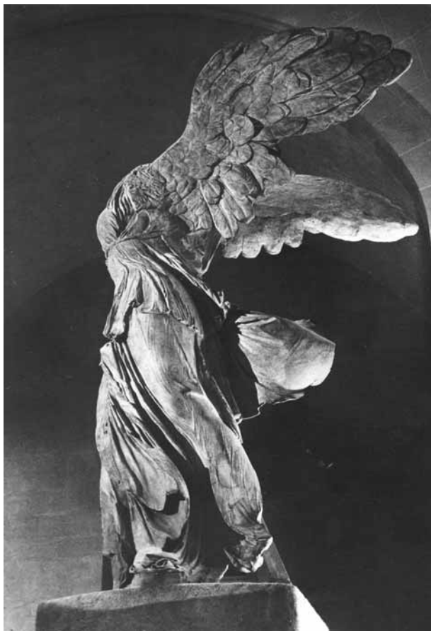
12. Victoria de Samotracia , siglos III-II a. C. Museo del Louvre.

valores decorativos desplazan, en cierta medida, a aquellos otros relacionados con su volumetría. Además, por regla general son piezas de tamaño reducido que requieren de una visión cercana y donde el detalle cobra gran importancia.