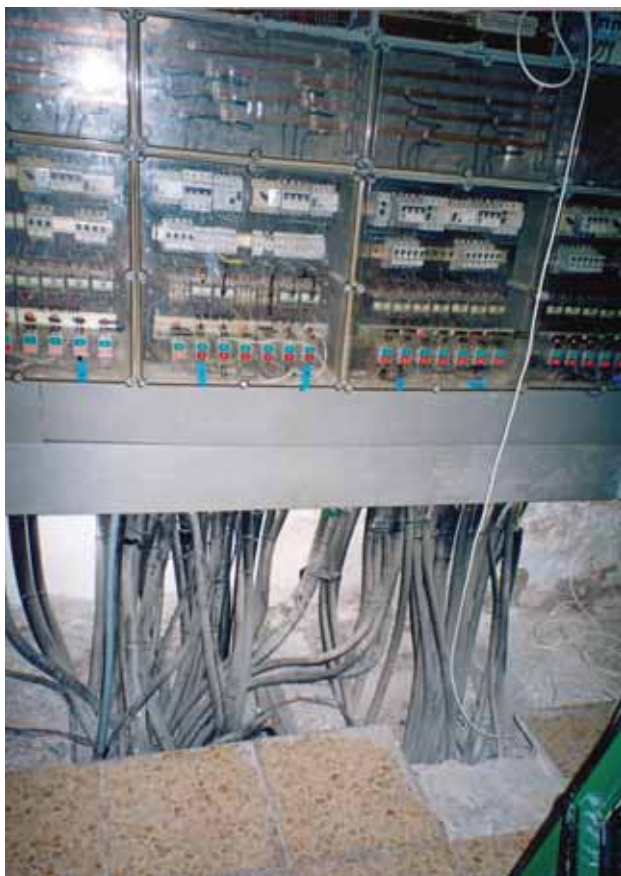
9. Cuadro eléctrico en condiciones precarias de uso. Como primer paso imprescindible en un PPEC siempre hay que considerar la minimización de riesgos (Foto: Archivo particular C.R.G.).

En resumen, la celebración de esta jornada técnica ha respondido a nuestras expectativas: asistieron numerosas instituciones (20), correspondientes a la casi totalidad de los museos de titularidad estatal de gestión exclusiva del Ministerio de Cultura, lo que denota una fuerte preocupación por este asunto. De las sesiones de preguntas y la mesa redonda final se pueden extraer una serie de conclusiones. En primer lugar, se constató que parte de los asistentes no habían tenido oportunidad de conocer la encuesta que en su momento (abril 2005) se remitió a los museos. Igualmente, numerosos asistentes desconocían la existencia de la Comisión. Esto plantea la necesidad de una mayor información y difusión de las actuaciones de esta Comisión, y la formación, en los museos, de comisiones interdisciplinarias para este tema.