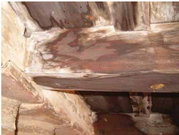
8. La humedad por filtraciones es la emergencia que con mayor frecuencia se constata en nuestros museos. Si su acción es continua, provocará daños irreversibles.