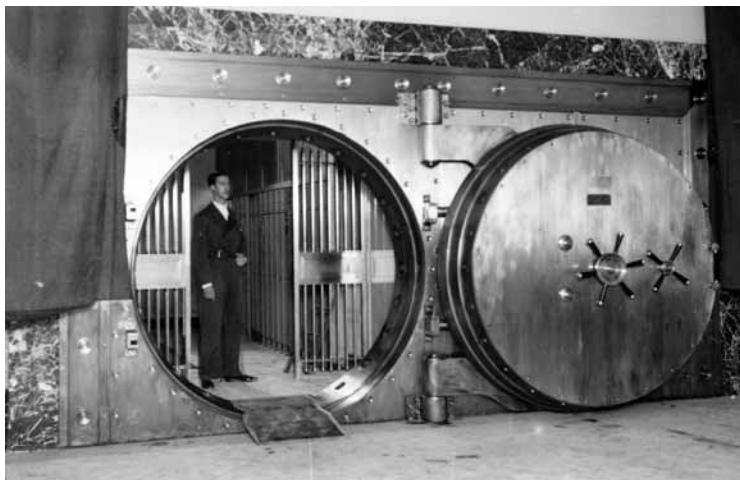
2. El análisis de recursos disponibles. Las pequeñas dimensiones de la puerta blindada del Banco de España obligan a descartar su uso como almacén provisional de las obras del Museo del Prado.

varios museos a fin de rentabilizar el trabajo invertido en la planificación. La coordinación con los recursos externos, el establecimiento de protocolos de actuación, o la formación en materia de rescate y recuperación de colecciones, pueden ser algunos de los temas en los que el trabajo en común resulte muy ventajoso. Por último, nos proponemos crear un grupo de orientación y asesoramiento dirigido a los museos, para que puedan recurrir a él durante la elaboración de sus respectivos planes.