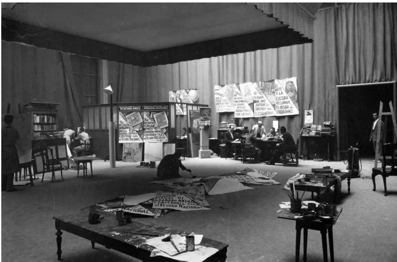
3. La creación de la conciencia. Alumnos de la facultad de Bellas Artes elaborando carteles para evitar la destrucción de las obras de arte en plena Guerra Civil española.