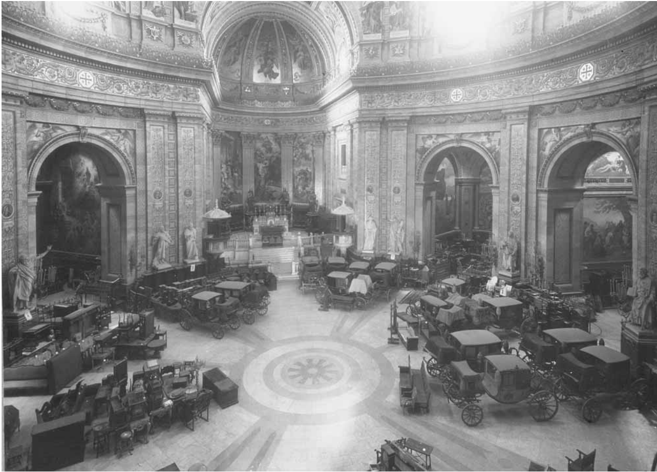
4. Almacenes provisionales externos en situaciones de emergencia. La nave central de la Basílica de San Francisco utilizada como depósito de bienes culturales (carrozas y mobiliario) por la Junta del tesoro Artístico durante la Guerra Civil Española.

noviembre de 2003, la organización de un curso específico con prácticas de evacuación de obras en Bangkok (Tailandia), la recuperación de los sistemas tradicionales intangibles de protección del patrimonio cultural o la creación, traducción y difusión de materiales didácticos para países con acusadas diferencias culturales y lingüísticas. A través de la red de 22000 miembros de ICOM, utilizando internet como recurso, los museos establecen redes coordinadas para actuar en caso de catástrofe y, a la vez, sus progresos son sometidos a constante evaluación en cursos de formación a distancia.