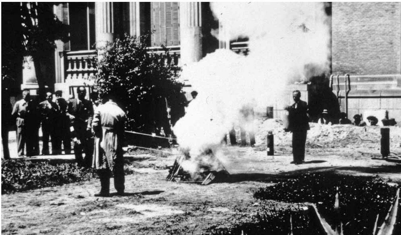
1. Formación ante situaciones de emergencia. Prácticas de extinción de incendios para personal subalterno en los jardines del Museo Arqueológico Nacional, junio de 1938 (Foto: Museo Nacional del Prado).

deterioro innecesario del patrimonio, una vez que la seguridad de las personas esté garantizada.