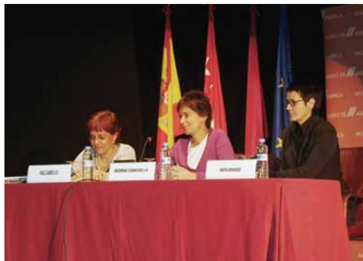
10. Comunicación inaugural de la Jornada de PPEC en el Museo de América. En la foto, la Subdirectora General de Museos, la Directora del Museo de América y la moderadora de la jornada.

Tras una primera fase de documentación e investigación de programas y estrategias similares en otros países, la Comisión abordó una metodología fundamentalmente práctica con el fin de conocer tanto la situación real como el grado de sensibilidad ante estos temas por parte de los profesionales. De ahí la elaboración de las encuestas y el planteamiento inicial con los museos piloto que se ofrecieron voluntarios. La Jornada Técnica del 16 de febrero ha servido para presentar públicamente la Comisión, los primeros resultados de su trabajo y las líneas maestras para el futuro inmediato. Entre otras actuaciones, se mantendrá el papel asesor de la Comisión para la elaboración de los planes en cada museo, se organizarán nuevas jornadas y actos de formación a medida que se disponga de resultados, y se trabajará en la redacción de los documentos solicitados por los museos. La excelente respuesta del público nos permite augurar prometedores resultados en el futuro.