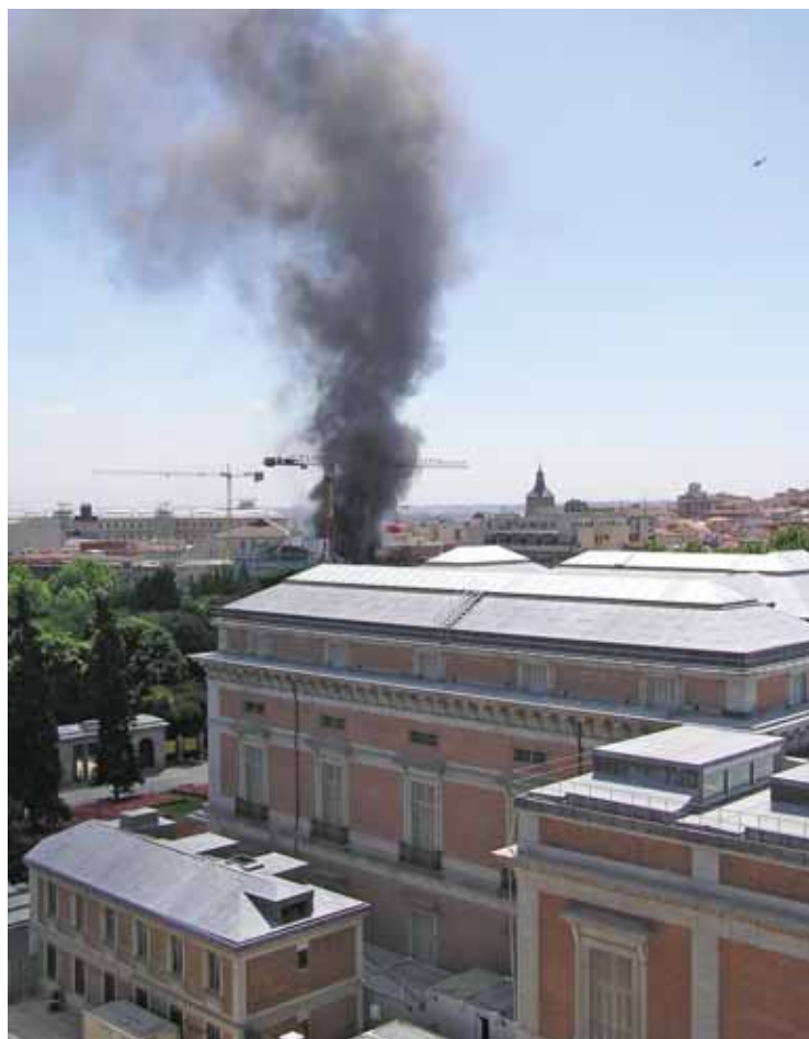
7. La columna de humo del incendio de la Subestación Eléctrica de Atocha tras el edificio del Museo Nacional del Prado y cerca del Museo Nacional Centro de Arte Reina Sofía, 15 de julio de 2004.