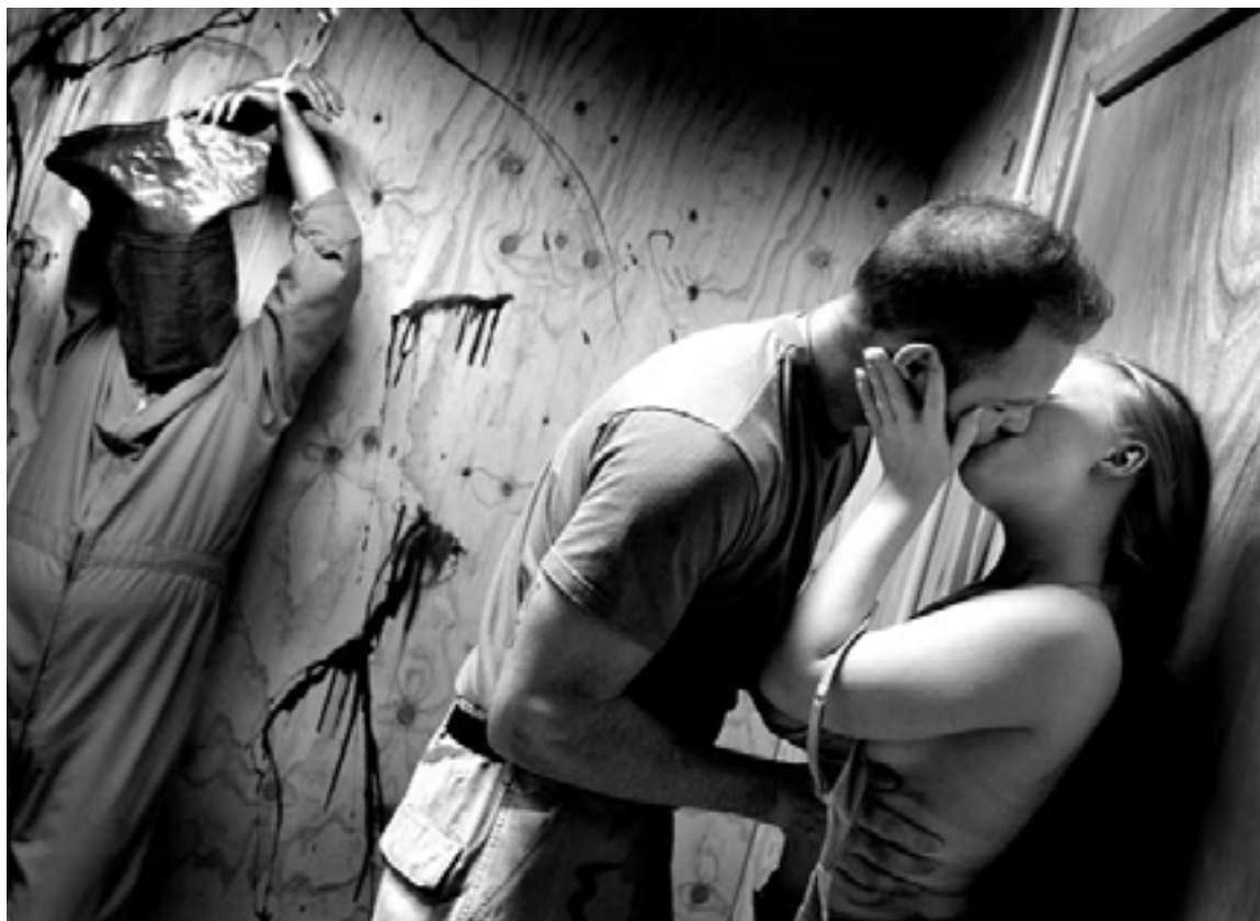
Standard Operating Procedure

ojos. Qué perpetrán las imágenes de perpetrador (Alianza Editorial, 2021) que le sirve de argumentario y estudio, se propone recorrer la vida de estas imágenes criminales en el universo del cine, varias de sus formas de reescritura, su inscripción en órdenes narrativos y documentales distintos. En pocas palabras, el ciclo es concebido como una vuelta de tuerca operada sobre estos "objetos encontrados" ( objets trouvés ) cuasi surrealistas (pero también de found footage , que es su traducción mutatis mutandis en el orden del cine documental) que son las imágenes de perpetrador. En el interior de estas películas. organizadas en torno a miradas