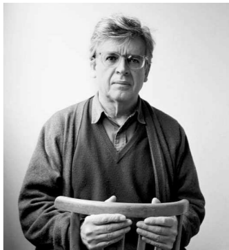
El cineasta Alain Cavalier

Segunda proyección y nota día 29. 22.00 David Cronenberg Sala 1 Camera (David Cronenberg, 2000). Int.: Leslie Carson, Marc Donato, Harrison Kane. Canadá. VOSE*. 6'. eXistenZ (eXistenZ , D. Cronenberg, 1999). Int.: Jennifer Jason Leigh, Jude Law, Ian Holm. Canadá / Reino Unido. VOSE*. 97'. Total programa: 103' Camera : Mientras un actor veterano lamenta el estado del cine y de la interpretación, un grupo de niños introduce a escondidas una cámara Panavision en el cine donde éste reside y deciden hacer una película con ella. eXistenZ : "Con el game pod enchufado directamente a la médula espinal del jugador sólo hay percepción en estado puro." (Serge Grünberg) Segunda proyección día 27.