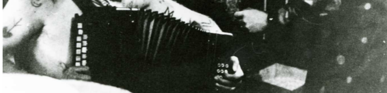
Michel Simon y Dita Parlo en L'Atalante (Jean Vigo, 1934)

22.00 David Cronenberg Sala 1 The Dead Zone (La zona muerta , D. Cronenberg, 1983). Int.: Christopher Walken, Brooke Adams, Martin Sheen. EE UU. VOSE*. 103' Ver nota día 16.