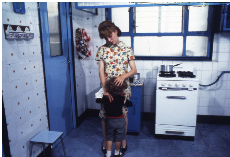
Verónica Forqué y Lolo García en La guerra de papá (Antonio Mercero, 1977)