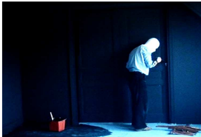
Alain Cavalier en Ce répondeur ne prend pas de messages (A. Cavalier, 1978)