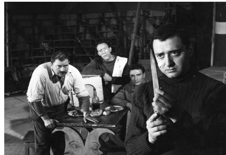
Antonio Ozores en Salto mortal (Mariano Ozores, 1961)