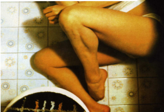
Marilyn Chambers en Rabid (Rabia) , D. Cronenberg, 1976)

Para las películas cuyo idioma original no es el español, se señala mediante siglas la versión de la copia prevista para la proyección. Las siglas VOSE indican que la copia está en versión original con subtítulos en español. El asterisco (*) significa que éstos son electrónicos. En las copias subtituladas en otra lengua, se incluye la inicial del idioma correspondiente seguida de /E* (subtítulos electrónicos en español). Cuando sea necesario especificar el idioma de la versión original proyectada, se añade su inicial tras las siglas VO.