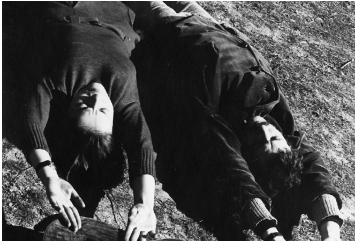
Margarita y el lobo

Recuerdo que, al ver por primera vez Carmen de Carabanchel , ya me