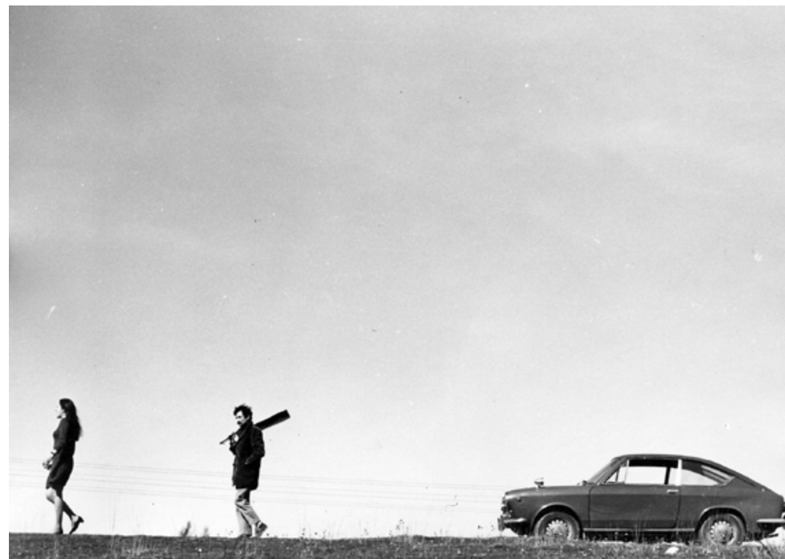
Margarita y el lobo

Margarita y el lobo era una impugnación al matrimonio y un canto feminista a la necesidad de una verdadera emancipación de la mujer. El fondo de la película chocó inmediatamente con el contexto en el que surgió, el de una sociedad franquista, machista, en el