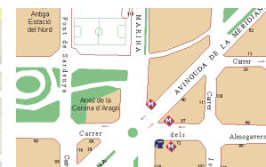
Seu C/ Almogàvers, 77

* La unitat responsable de la Carta de Serveis és la Direcció de l'Arxiu.